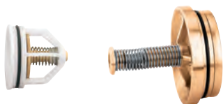
Uitstroomkeerklep voor series 574 en 575. Clapet aval pour séries 574 et 575.