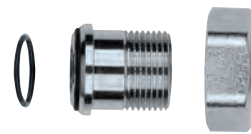
Staatstuk, wartel en O-ring voor radiator- en voetventielen 3/4". Ecrou, manchon conique et O-ring pour vannes de radiateurs et coudes de réglage 3/4".